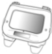
Speedglas 9100 Automatikscheißfilter