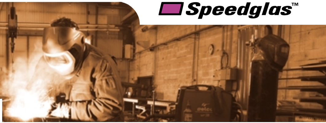
3M™ Speedglas™ 9100 Schweißmaske