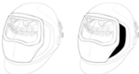
Speedglas 9100 Schweißmaske ohne Automatikscheißfilter