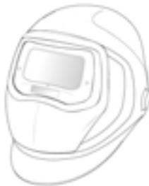
Speedglas 9100 Schweißmaske mit Automatikscheißfiltern