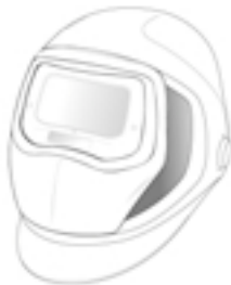
Speedglas 9100 Schweißmaske mit Automatikscheißfiltern und Seitenfenstern